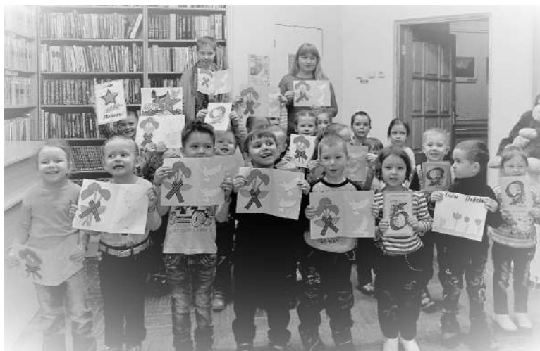
Рис 7. Читатели Центральной городской библиотеки имени В.В. Маяковского с созданными в рамках Акции творческими работами (Чувашская Республика, г. Чебоксары)