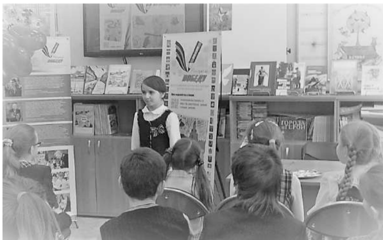
Рис 6. Проведение Акции в Библиоцентре детского чтения Выборгского района Санкт-Петербурга (Санкт-Петербург)