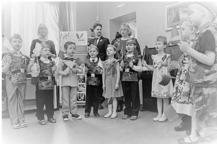
Рис 3. Подведение итогов Акции на базе дошкольного отделения ГБОУ «Школа № 2101» (Москва)