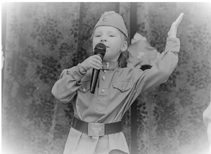
Рис 2. Старт Акции на базе дошкольного отделения ГБОУ «Школа № 1359 имени авиаконструктора М.Л. Миля» (Москва)