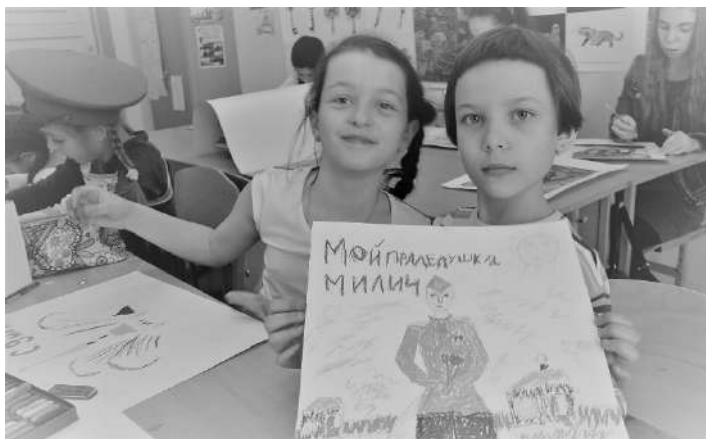
Рис 4. Учащиеся ГБОУ «Гимназия № 92 Выборгского района» принимают участие в Акции (Санкт-Петербург)