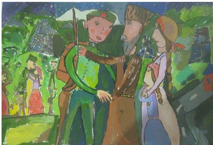
Цокова Кира, 6 лет «Возвращение домой» Республиканский Лицей Искусств (г.Владикавказ)