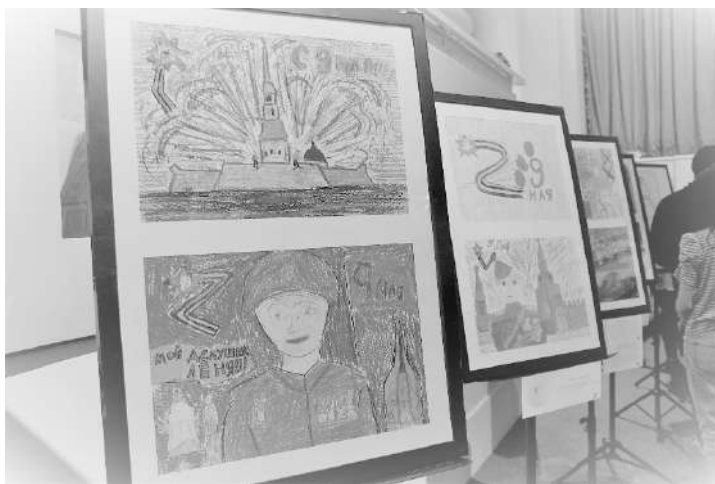
Рис 5. Выставка лучших работ учащихся школ Выборгского района Санкт-Петербурга – участников Акции (Санкт-Петербург)