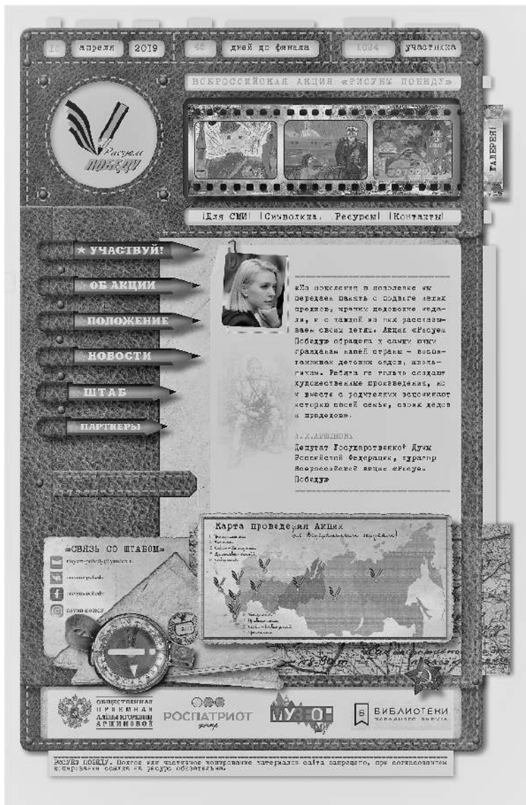
Рис 1. Внешний вид сайта Всероссийской акции «Рисуем Победу»